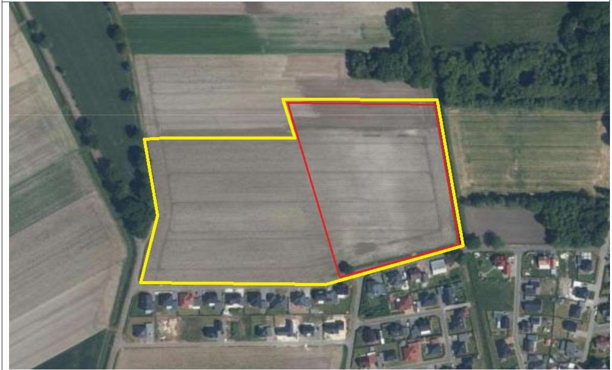
Abbildung 2.1: Lage des Geltungsbereichs des B-Plan Nr. 32 „Nördlich Koopsweg“ (rot) im Raum und des Geltungsbereichs der 153. Änderung des Flächennutzungsplans (gelb)

Die beiden Geltungsbereiche grenzen im Süden an vorhandene Wohnbauflächen, Straßen und bestehende Wohnbebauung an. Östlich verläuft der Graben „Ahlener Müllkanal“, im Norden und Westen schließen sich landwirtschaftliche Nutzflächen an. In der Umgebung finden sich lichte Gehölzstrukturen (Einzelgehölze und lückige Baumreihen) sowie ein kleines Waldstück in der nordöstlichen Umgebung des Vorhabenbereichs.