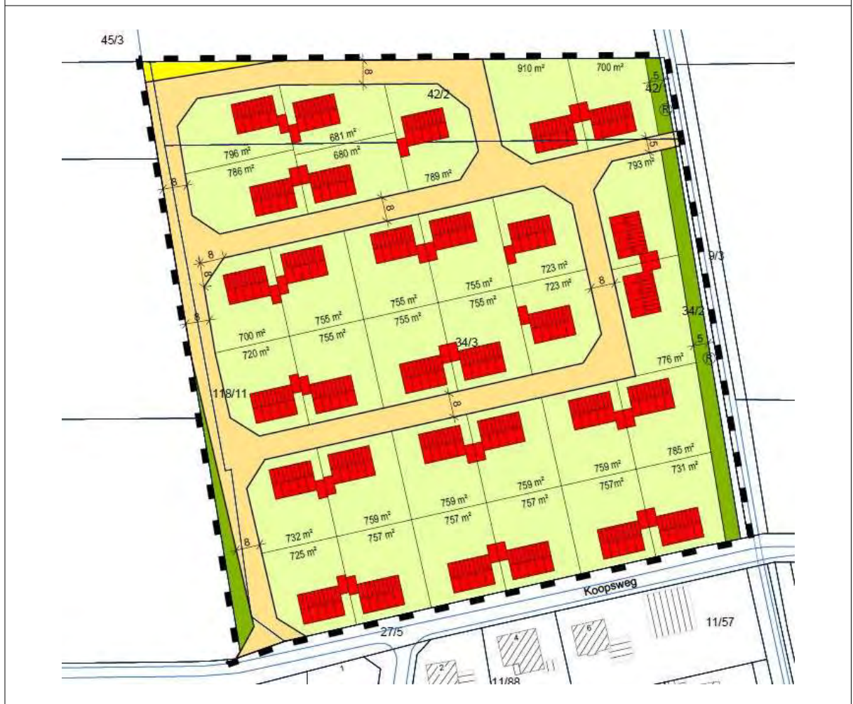
Abbildung 2.2: Bebauungsvorschlag i. Geltungsbereich d. B-Plans Nr. 32

Entlang der Ostseite des Geltungsbereichs soll entlang des „Ahlener Müllkanals“ eine öffentliche Grünfläche mit einer Größe von rund 0,11 ha und der Zweckbestimmung als Räumstreifen festgesetzt werden. An der Westseite erfolgt ebenfalls die Festsetzung einer schmalen öffentlichen Grünfläche von 287 m 2 . An der Nordgrenze des Geltungsbereichs ist eine Fläche für Versorgungsanlagen, für die Abfallentsorgung und Abwasserbeseitigung sowie für Ablagerungen mit 152 m 2 vorgesehen.